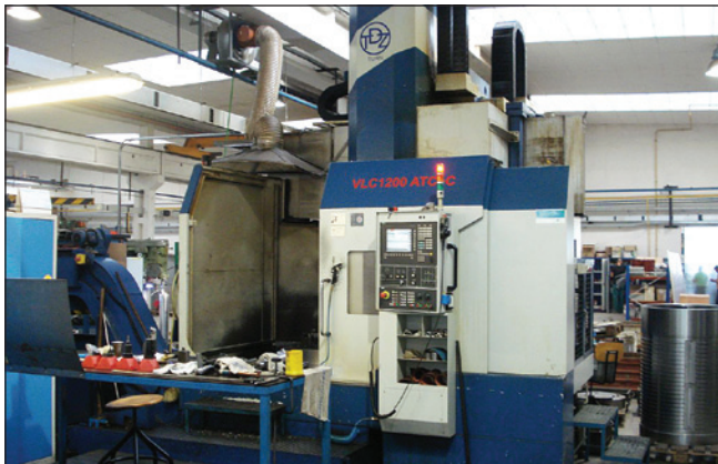
Dříve dodaný stroj VLC v provozu

Společnost TDZ Turn s.r.o. slaví v letošním roce 2016 právě 10 let od zahájení své činnosti. Pro své zákazníky při této příležitosti připravila řadu novinek a mimo jiné chystá také významné novinky v oblasti designu. Design ovlivňuje prodej, protože je úzce spojen s marketingem, musí být brán vážně i při nabídce tak specifického zboží, jakým jsou těžké obráběcí stroje, mezi nimi samozřejmě i vertikální soustruhy série VLC.