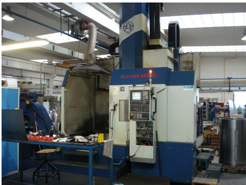
Dříve dodaný stroj VLC v provozu